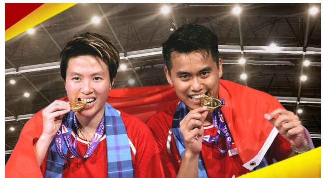
VM guldvinderne 2017: Natsir/Ahmad, Indonesien

Benarbejde - teknisk træning Individuel træning - videoanalyse Fokuserings/mental træning - Smartraining Konditionstræning på banen Taktisk/kamptræning og meget andet.